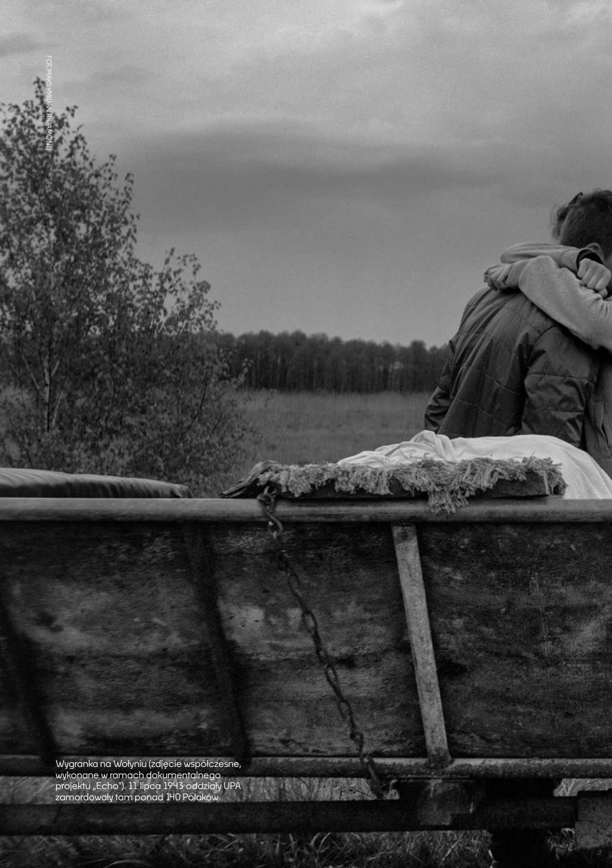
Wygranka na Wołyniu (zdjęcie współczesne, wykonane w ramach dokumentalnego projektu „Echo”). 11 lipca 1943 oddziały UPA zamordowały tam ponad 140 Polaków