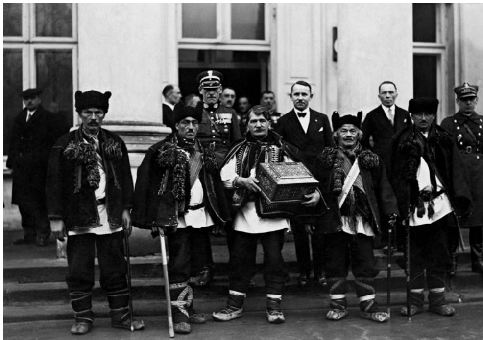
Warszawa, 19 marca 1930. Delegacja Hucutów z okolic Kosowa (woj. stanisławowskie) przybyła do Belwederu złożyć życzenia imieninowe Józefowi Piłsudskiemu. Jeden z delegatów trzyma prezent dla Marszałka – szkatułkę w stylu huculskim