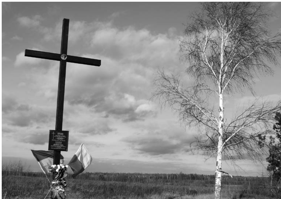
Stara Kamionka k. Huty Stepańskiej, 13 listopada 2010. Krzyż i tablica upamiętniająca nieistniejącą polską osadę