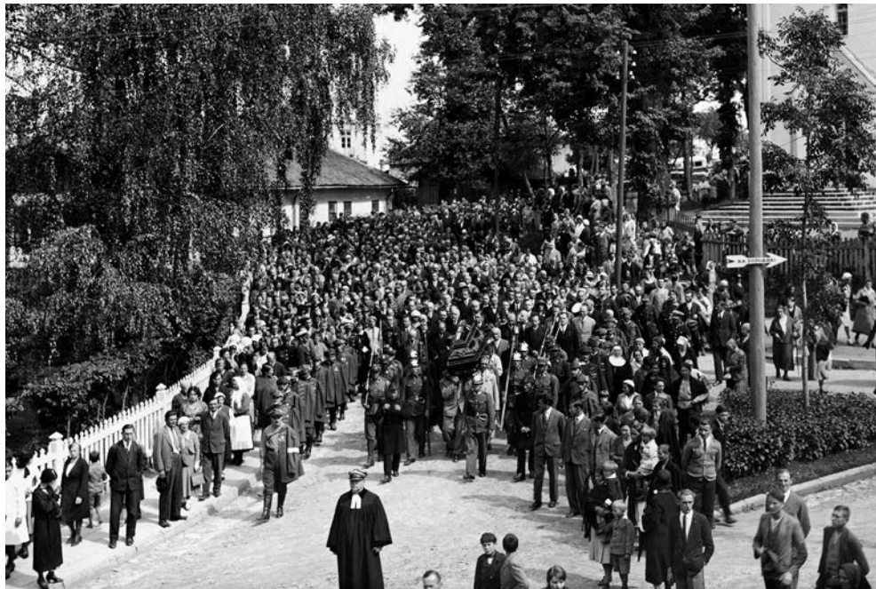
Truskawiec k. Lwowa, sierpień 1931. Początek drogi do Warszawy trumny ze zwłokami Tadeusza Hołówki, zastrzelonego przez nacjonalistów ukraińskich