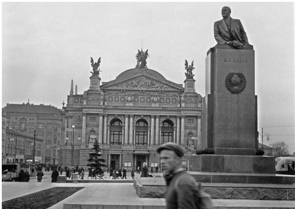
Centrum Lwowa, lata 50. Pomnik Lenina przed gmachem Opery Lwowskiej na jednej z głównych promenad miasta – prospekcie Lenina (w okresie międzywojennym: Wały Hetmańskie, obecnie: Prospekt Swobody)