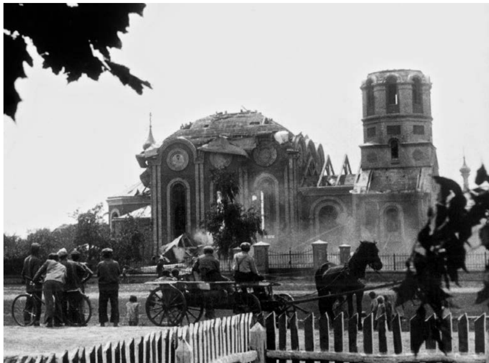
Kryłów k. Hrubieszowa, 1938. Niszczenie cerkwi