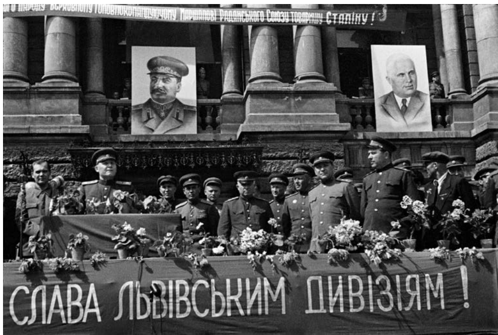
ФОТ. АРКАДУШАНКНЕГ / ZEBROŃO W MARI ANAPOLSKIE WNE ZHOPIKOWE-SHANKNEГ