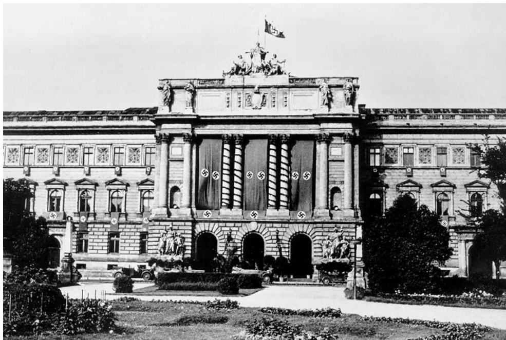
Lwów, sierpień 1941. Gmach Sejmu Krajowego – siedziba władz dystryktu Galicja