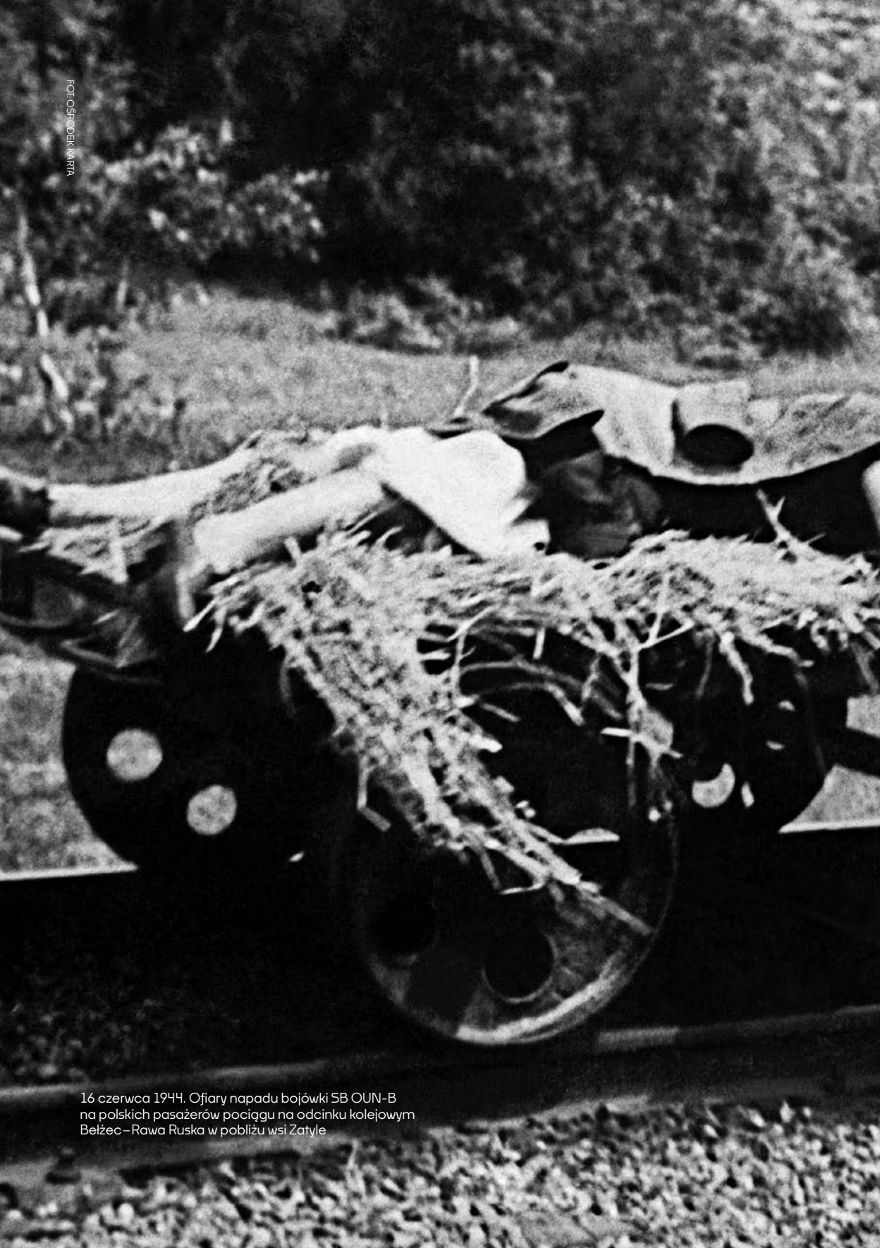
16 czerwca 1944. Ofiary napadu bojówki SB OUN-B na polskich pasażerów pociągu na odcinku kolejowym Bełżec – Rawa Ruska w pobliżu wsi Zatyłe