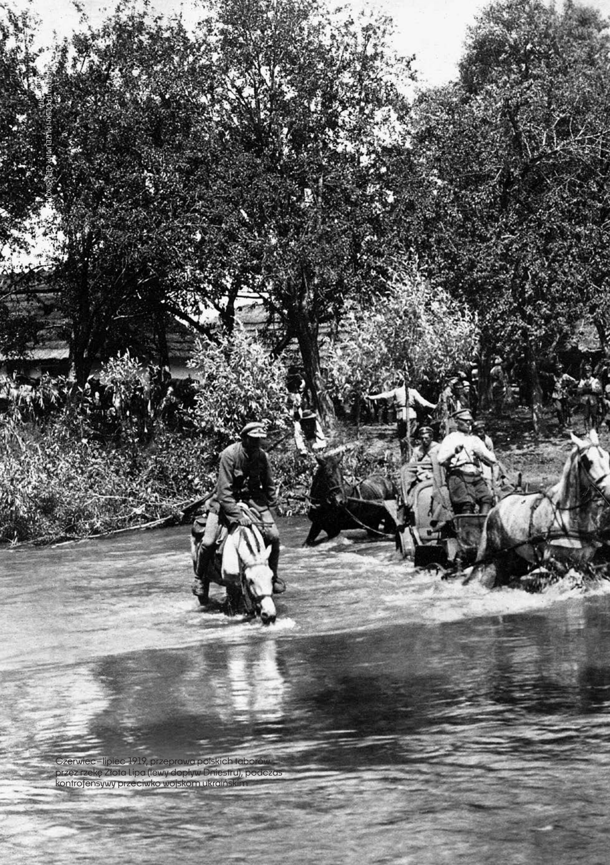
Czerwiec – lipiec 1919, przeprawa polskich taborów przez rzekę Złota Lipa (lewy dopływ Dniestru), podczas kontrofensywy przeciwko wojskom ukraińskim