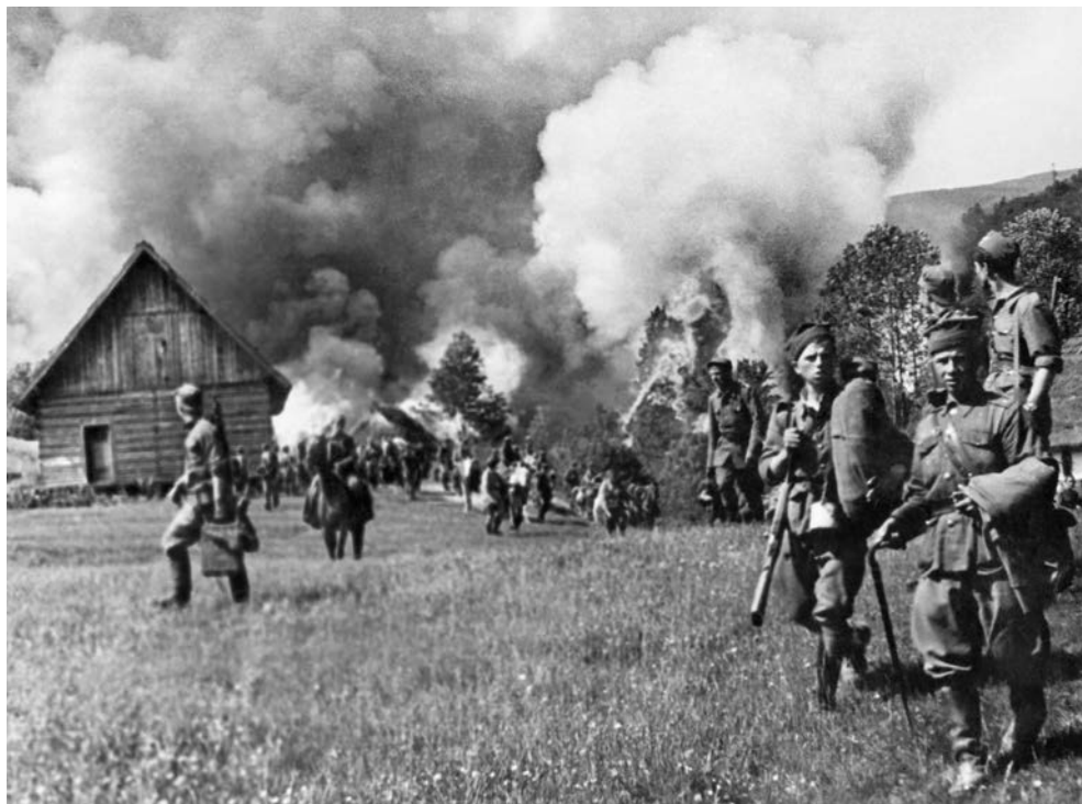
Wieś Zatwarnica podpalona przez żołnierzy 34 pp, 31 lipca 1946